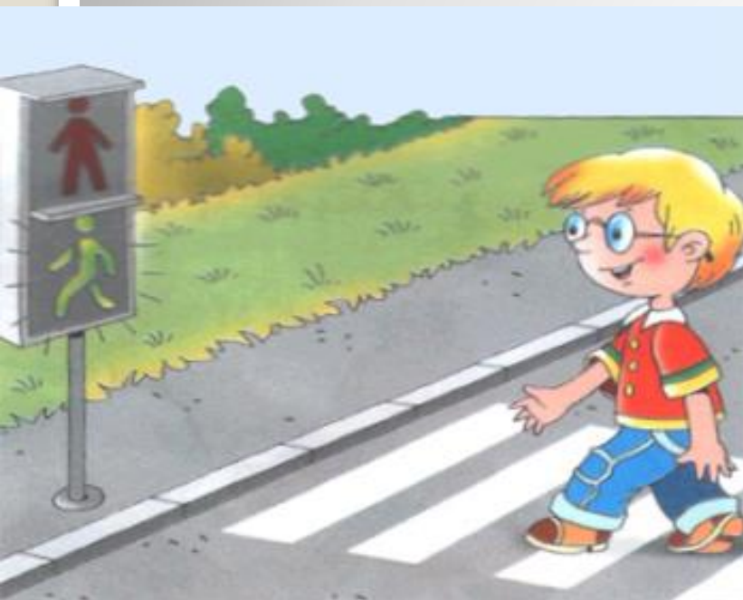
Регулируемый пешеходный переход, (есть светофор)