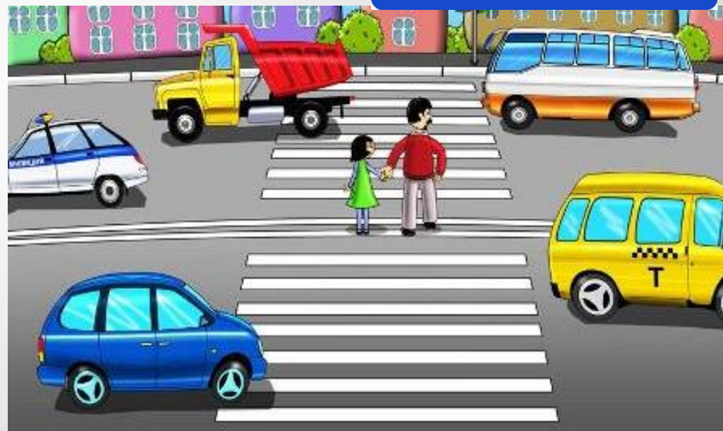
Нерегулируемый пешеходный переход (нет светофора)